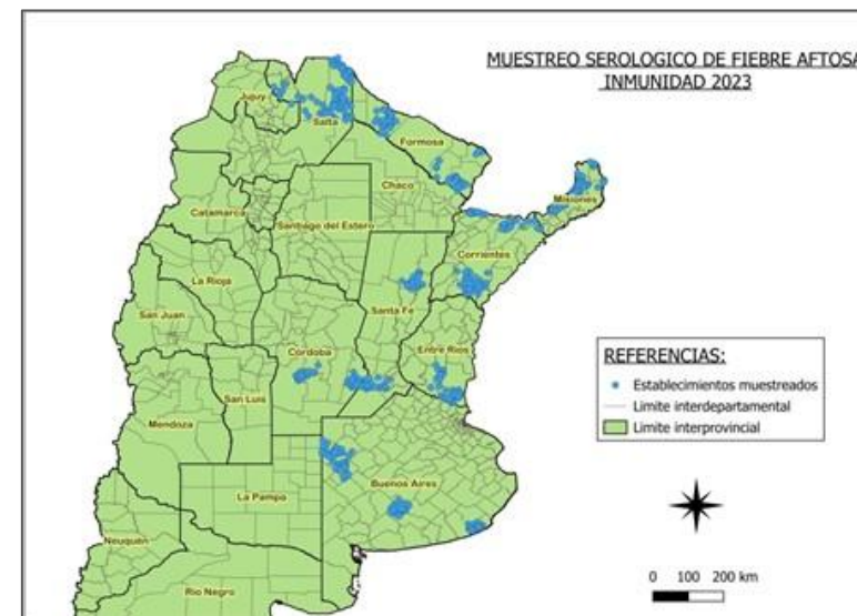
Mapa con georreferenciación:

Resultados obtenidos con ambas pruebas diagnósticas según la categoría de animal y para el total de la población: